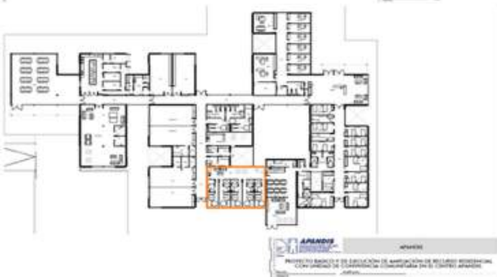
Proyecto de ampliación de Residencia . Instalaciones La Hoya. Presupuesto de coste: 101.931,24 €