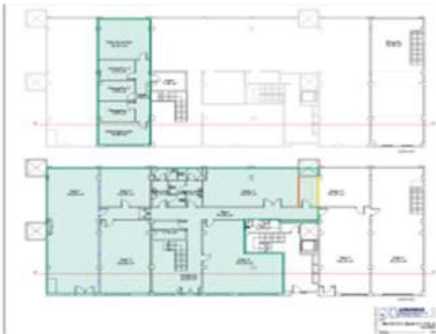
Acondicionamiento de las Instalaciones de C/ Panadería como Centro de Día. Coste Presupuestado: 89.918 €