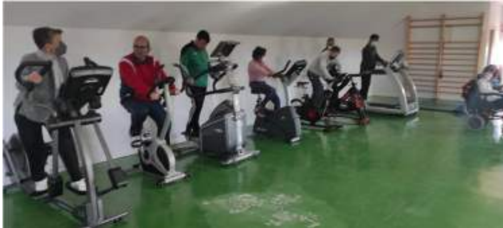
RESIDENCIA: Programa de Deporte