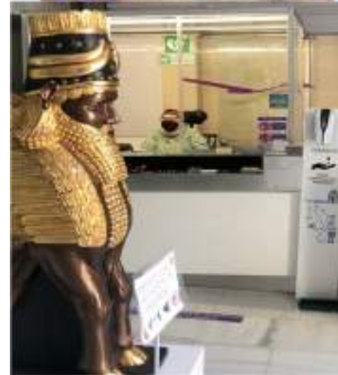
Continuidad de la inserción laboral en el Hospital Virgen del Alcázar de Lorca y en le Museo del Paso Blanco