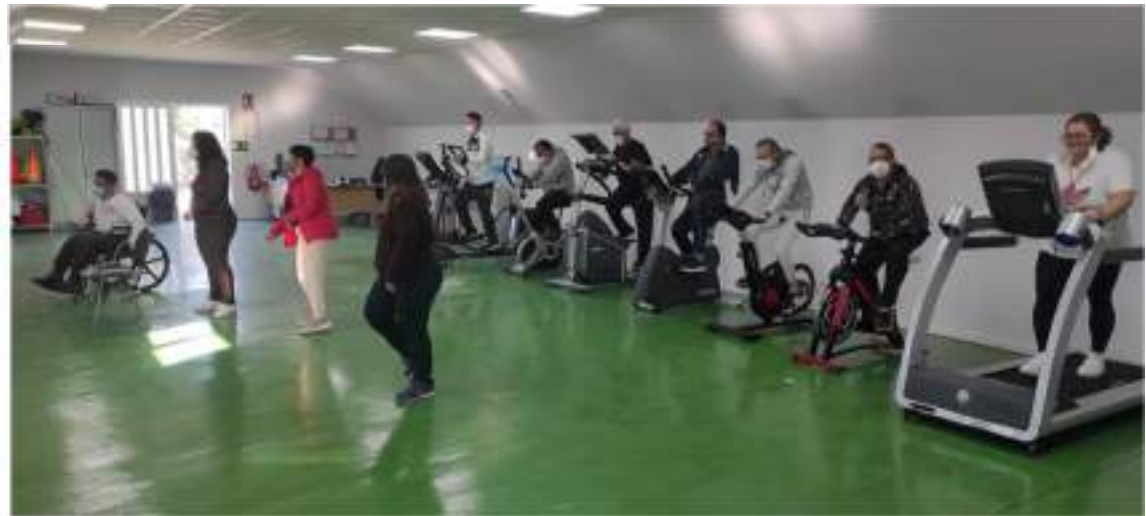
CENTRO DE DIA: Programa de Deporte